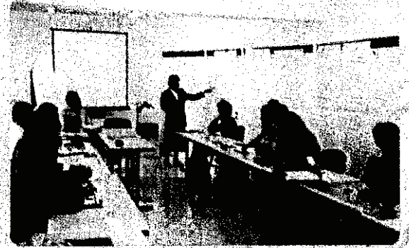
Χαρακτηριστικό στιγμιότυπο από αναπτυξιακή δραστηριότητα της Ακαδημίας

Οι ενδοοργανωσιακές αναπτυξιακές δραστηριότητες βρίσκονται σε μια γόνιμη σχέση αλληλεπίδρασης και συνέργειας με τις δραστηριότητες επιμόρφωσης: Αφενός, καταβάλλεται συστηματική προσπάθεια τα επιμορφωτικά προγράμματα να οδηγούν σε πρωτοβουλίες ενδοοργανωσιακής ανάπτυξης στους οργανισμούς των εκπαιδευομένων. Αφετέρου, οι δραστηριότητες ενδοοργανωσιακής ανάπτυξης ενισχύονται και αντλούν και πάλι υποστήριξη από την επιμόρφωση των