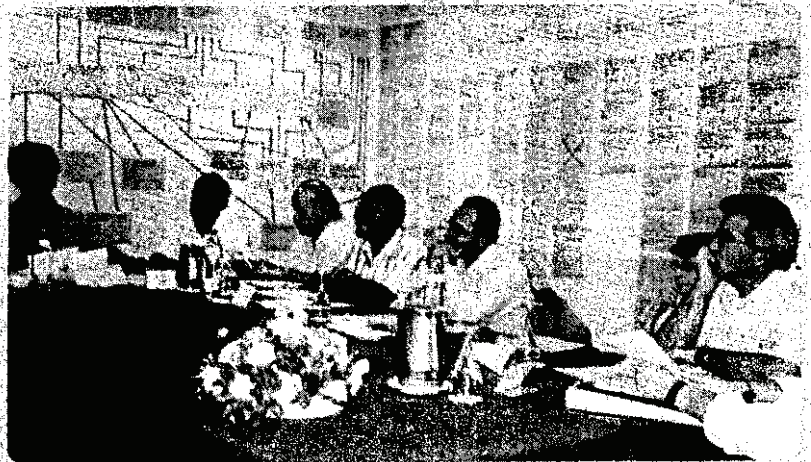
Ο Υπουργός Συγκοινωνιών και Έργων κ. Αβέρωφ Νεοφύτου μετέσχε στις εργασίες εργαστηρίων για συναινετικό προσδιορισμό ενεργειών, προς αντιμετώπιση των προβλημάτων του λιμανιού της Λεμεσού