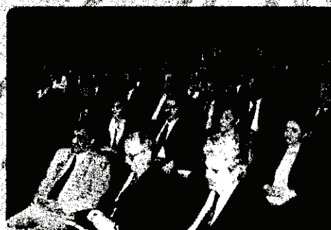
Στιγμιότυπο από την Ημερίδα Ανωτάτου Επιπέδου με θέμα "Οι νέες προοπτικές της ΕΕ και η Κύπρος" με εισηγητή τον καθηγητή κ. Ιωακειμίδα